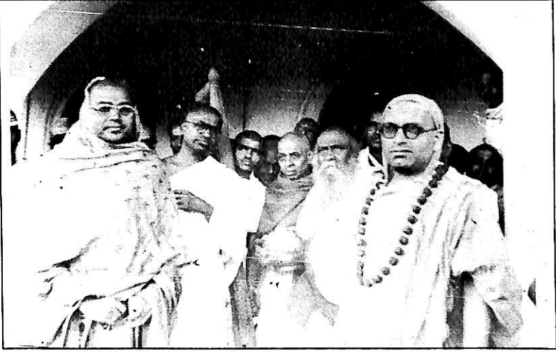
श्रुंगेरी मठाधीश अभिनव विद्याभारती तीर्थ जगद्गुरुंसमवेत (सन १९५६)

अशी स्थाने बनलेली आहे. श्रीगोकर्णपर्वतगाळी जीवोत्तम मठाचे स्वामी मुंबईत असताना त्यांचे वास्तव्य याच मठांत होत असते आणि बृहद् मुंबईत वास्तव्य करून राहणाऱ्या मठानुयायी वर्गाला व इतर भाविकांना श्रीगुरुदर्शन घेण्याची, त्यांच्या प्रासादिक प्रवचनाचे श्रवण करण्याची आणि त्यांचे आशीर्वाद प्राप्त करण्याची ती एक दुर्मिळ संधि असते. या मठांत इतर मठांचे स्वामीजी देखील आग्रहाने वास्तव्य करीत असतात. चौफेर विस्तारलेल्या मुंबई महानगरीतील इतस्ततः विखुरलेल्या भक्तजनांशी संपर्क ठेवण्याच्या दृष्टीने वडाळा येथील श्रीद्वारकानाथ भवन हे त्यांना अनुकूल केंद्र वाटल्यास आश्चर्य नाही.