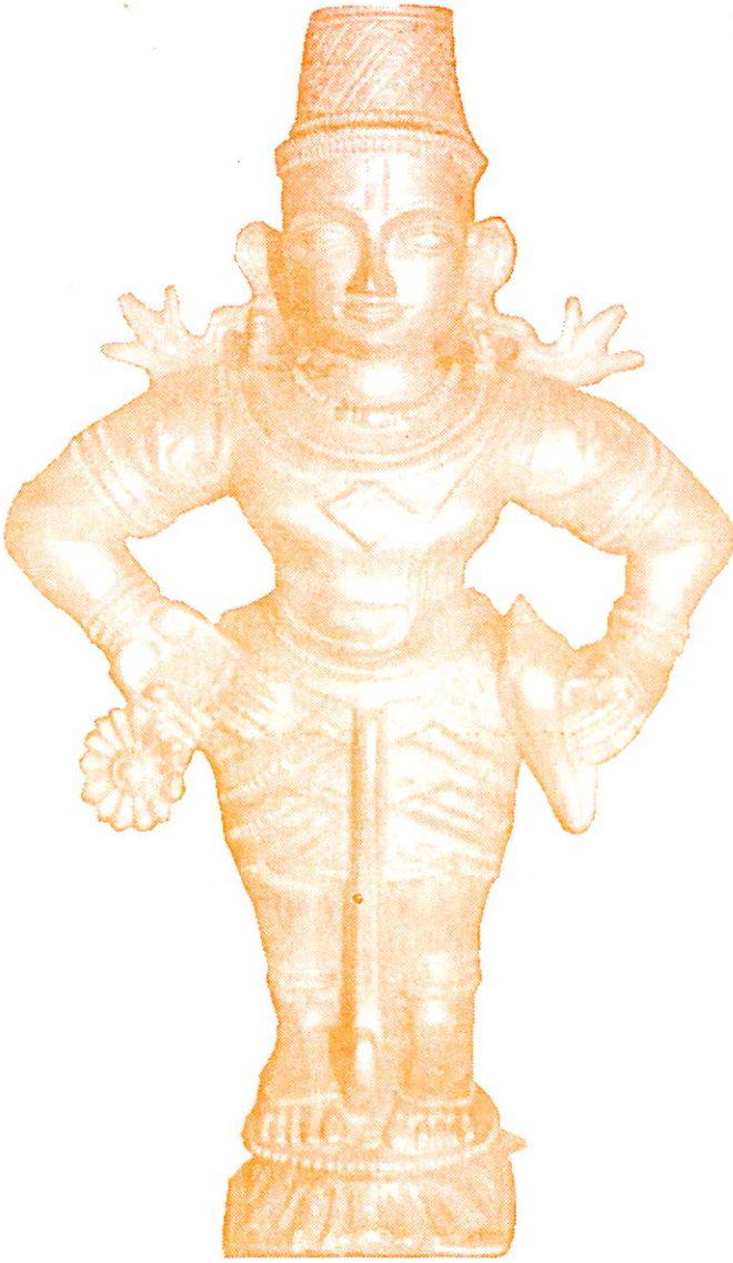
श्रीदिग्विजय विट्टल प्रतिमा (बसरूर)