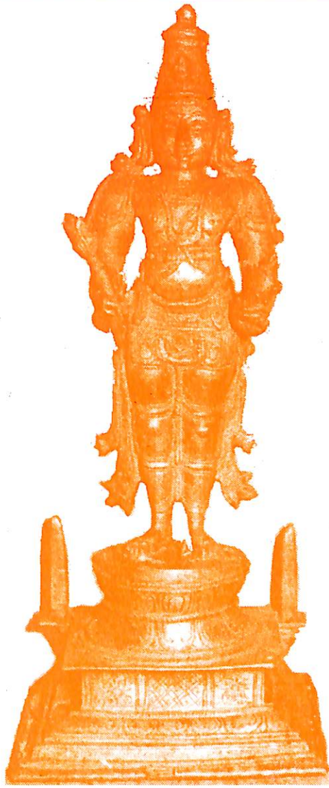
श्रीभूविजय विट्ठल प्रतिमा (गोकर्ण)