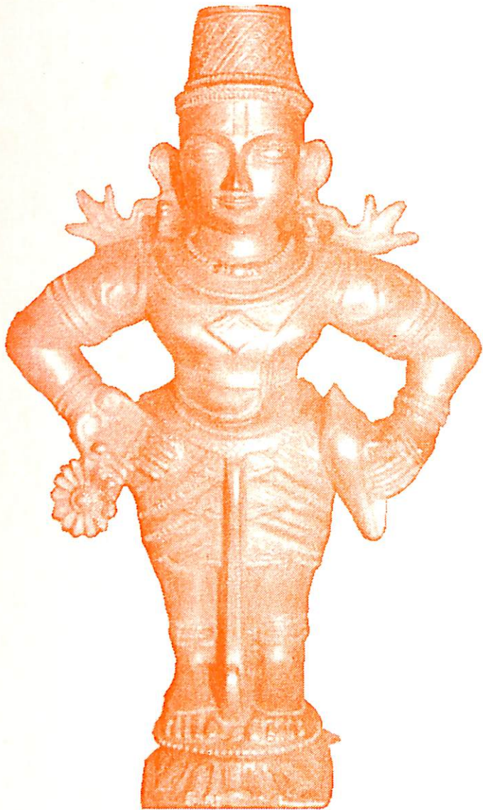
ಶ್ರೀ ದಿಗ್ವಿಜಯ ವಿಟ್ಟಲ ದೇವರು ( ಬಸರೂರು )