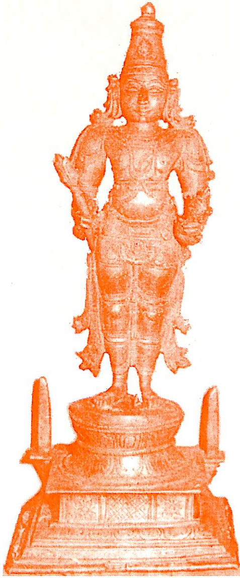
ಶ್ರೀ ಭೂವಿಜಯ ವಿಟ್ಟಲ ದೇವರು ( ಗೋಕರ್ಣ )